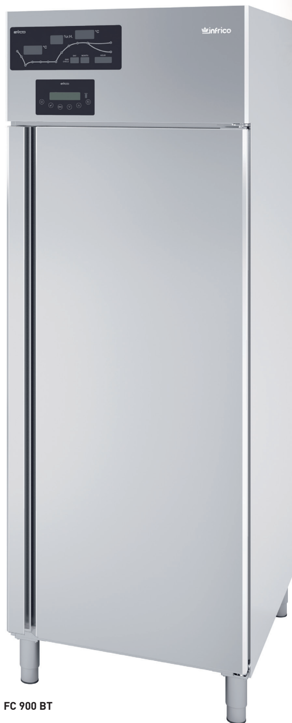
FC 900 BT