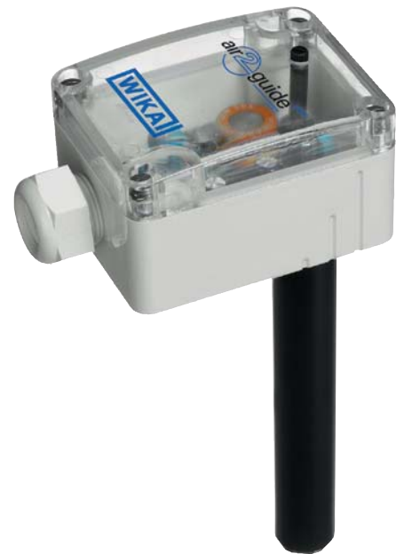
Sensor de calidad del aire air2guide VOC Modelo A2G-80