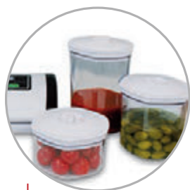
Contenitori sottovuoto Vacuum containers