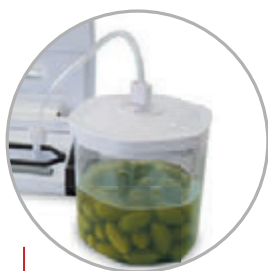
Tubo per connessione contenitori Connection tube for containers