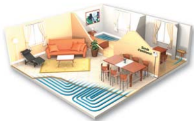
Difusión por el suelo