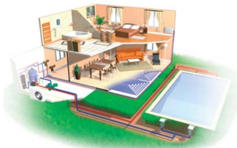
Difusión por el suelo en la planta baja, fancoils o radiadores de baja temperatura en el piso superior y climatización de su piscina.