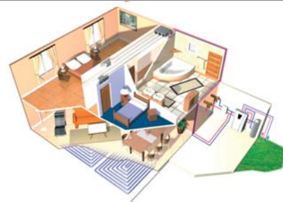
Difusión mixta por el suelo en la planta baja y Residenciat en el piso superior.