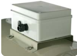
Caja de bornes exterior, Protección IP66