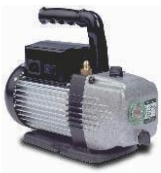
Bomba de vacío 2F-3* (dimensiones en mm)

Garantía de calidad: Cada bomba se prueba e inspecciona individualmente.