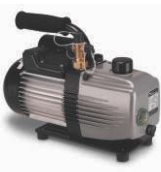
Bomba de vacío 2F-10 (dimensiones en mm)

* La versión estándar lleva aspiración de 1/4".