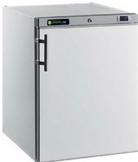
MAC185 PO BL