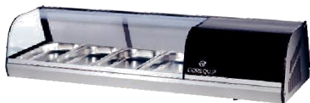
VRGI 1P 4B INOX