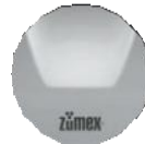
Versatile Pro Podium Silver

Ampliamos la posibilidad de Versatile añadiendo un pódium que permite aumentar la capacidad de residuos y facilitar su desalajo con un práctico trolley. Indicada para contextos de autoservicio y supermercados.