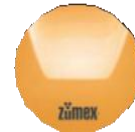
Versatile Pro Podium Orange